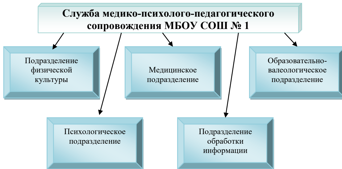
Организационная структура службы медико-психолого-педагогического сопровождения образовательного процесса в МБОУ СОШ №1.

Медицинское подразделение образовано медицинскими работниками, обслуживающими школу, и расширившими круг своих функциональных обязанностей в контексте здоровьесбережения по договоренности с руководством детской поликлиники, в штате которой они находятся.